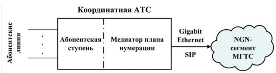
Рис. 1. Основная идея модернизации аналоговых АТС

Система-112 осуществляет централизованное обслуживание обращений, направляемых в экстренные оперативные службы по единому трехзначному номеру, который принят для всех стран Европы. Обращения могут формироваться не только при помощи телефонных аппаратов, но и за счет использования других терминалов, что показано в левой части рис. 2. Эта иллюстрация отражает модель перспектив-